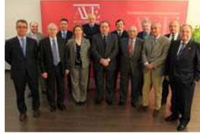
Miembros de la Junta Directiva de AVE