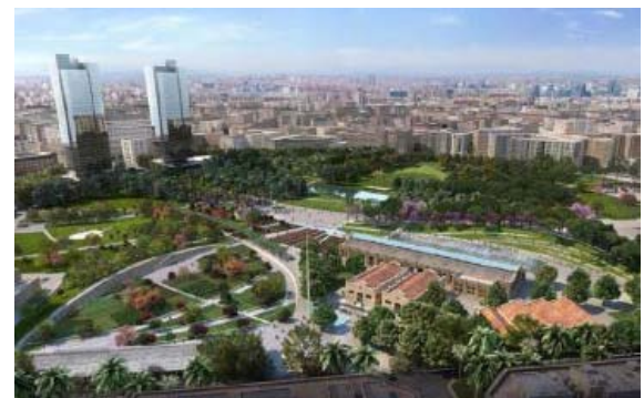
VALENCIA, 21 (EUROPA PRESS)

El Diari Oficial de la Comunitat Valenciana (DOCV) publica este martes la adjudicación y formalización del diseño y proyecto de urbanización del Parque Central de Valencia por un importe total de 3.481.000 euros a la UTE Gustafson Porter Limited - Borgos Pieper Limited - Nova Ingeniería y Gestión, SL - Grupotec Servicios de Ingeniería, SL.